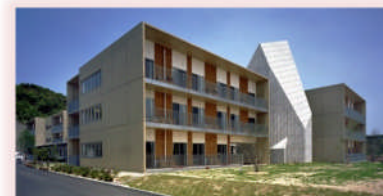
特別養護老人ホーム愛の園の全景