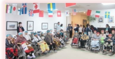
恒例の秋の大運動会