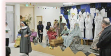
入居者と職員によるクリスマスの降誕劇