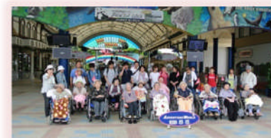
アドベンチャーワールドへ春の遠足