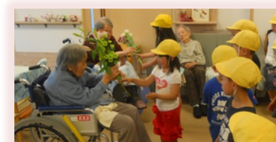
岩田幼稚園園児からお花のプレゼント