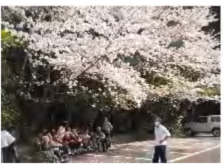
デイサービスセンター愛の園

この日は人出もまばらで、ゆつくりと駐車場の脇にあるソメイヨシノの下でお花見をする事が出来ました。お茶とおやつを頂きながら大きな桜の枝に包まれて、幸せな春のひと時を過ごせました。