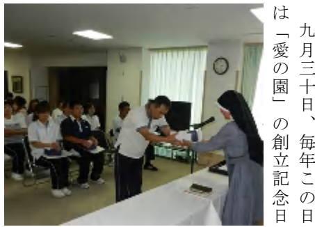
九月三十日、毎年この日は「愛の園」の創立記念日

です。一九七二年、岩田の地に特養を設立。地域の皆さんのご協力のもと今年もこの日を迎える事が出来ました。