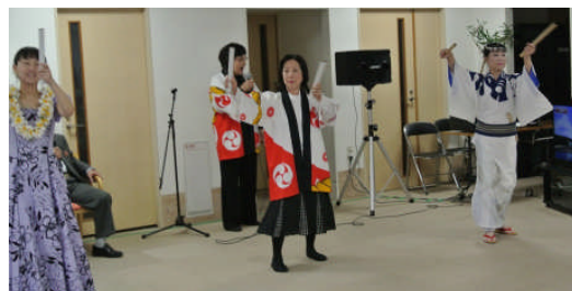
ボランティアグループ「ラブワーク」の皆さん10人が訪問してくださいました。フラダンス・歌謡曲・舞踊など、盛り沢山のステージが好評でした。4/2