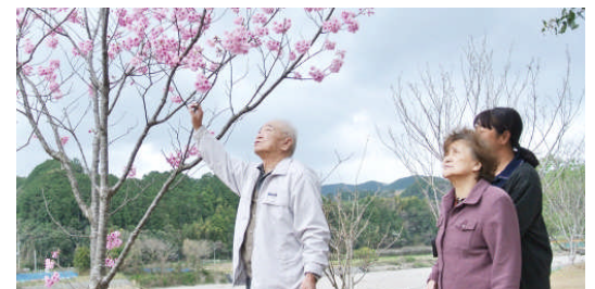
10日遅れと言われるソメイヨシノにしびれをきらして出掛けてみましたが三分咲きがやっと。富田川沿いの早咲きのサクラを少しだけ楽しみました。4/6