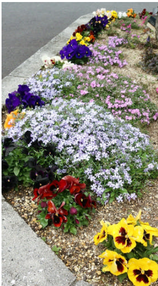
色々な花を楽しめる時季になりました。園芸ボランティアの皆さん、ありがとうございます。

上富田町社協を通じて町内会ごとに毎月1回清掃などのボランティア活動をしていただきましたが、昨年度で終了しました。長い間ありがとうございました。心より感謝申し上げます。