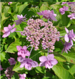
愛の園前に咲くアジサイが梅雨の日々に彩りを添えています。