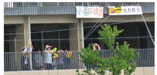
ショートステイご利用者もテラスから阪神を熱烈応援！

家族介護を支えてもらっている、これからも世話になりたい、との声もお寄せいただきました。これを励みとして皆さんの期待に応える運営のため改善を続けてまいります。今後もご意見・ご要望をお寄せいただければ幸いです。