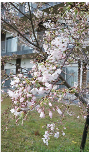
1・3ユニット前のサクラです。固い地盤に負けず花をつけてくれました。大きく育ってほしいですね。

3月に全職員を対象とした接遇マナー研修を行い、清潔な身だしなみ、爽やかな笑顔、丁寧な言葉使い、ほっとできる雰囲気、暖かい眼差しを身に付けることの大切さを学びました。愛の園の入居者の皆さんに、利用者の皆さんに、ボランティアの皆さんに、愛の園の職員はどのように映っているのでしょうか。皆さんのことを大切に想い、健康で幸せに暮らしていただきたいというプロの介護職員の真心を伝えることができるよう、努力してまいります。改めてよろしくお願いたします。