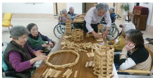
トイランドヨネクラさんによる「カプラ」のお楽しみ会です。ハラハラしながら積み上げたり崩れた時の大きな音に驚いたり楽しい1時間です。 4/3