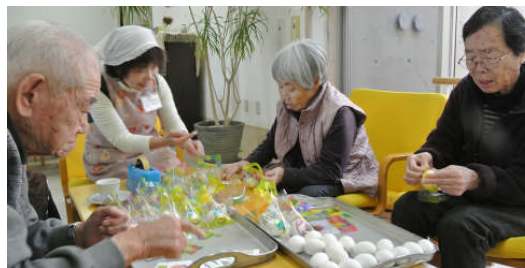
イースターの前日に恒例のイースターエッグの準備です。袋に入れてカードを添えてテープで止めて、180個を40分ほどで作りました。 3/26