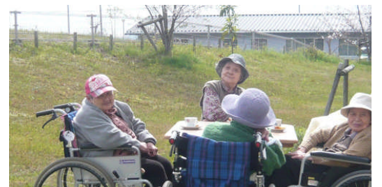
春の陽気に誘われて南の芝生でティータイムです。斜面に咲くサクラの近くまで行けないのが残念でしたが、プチお花見を楽しむことができました。 4/6