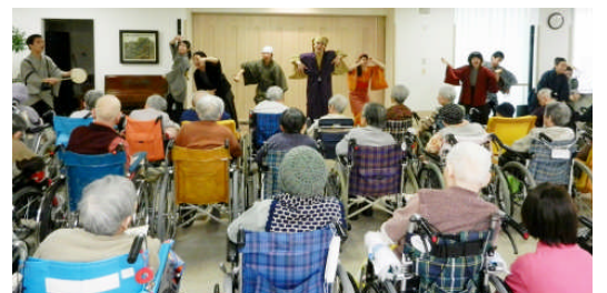
今年も桜美林大学の学生が楽団寸劇「水戸黄門」を披露してくれました。迫力のある劇に皆さん大興奮。 2/28