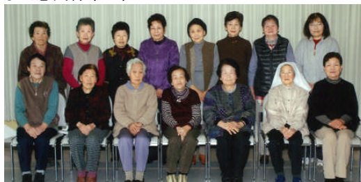
2014年第20回定例会での記念写真