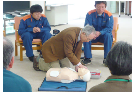
消防署の方に教わりながら救命講習を受ける様子

これからも愛の園にきてくださるボランティアの皆さんの活動が円滑に行えるよう支援をしていきたいと考えています。