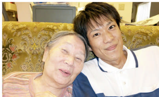
すてきな笑顔に励まされています