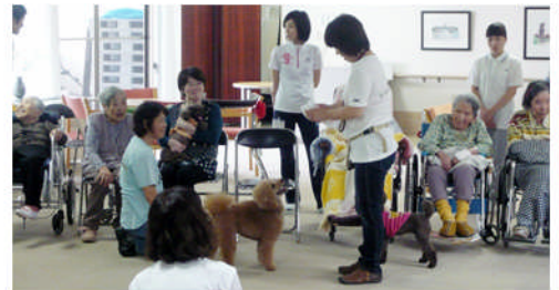
「それいけ、マリモと愉快的仲間たち」の活動の様子。可愛い犬達の姿や披露してくれる芸に癒されています。

人と犬とのふれ合いを通して、少しでも多くの人達が癒しを感じていただけると信じ、今後も活動を続けて行きたいと思えます。